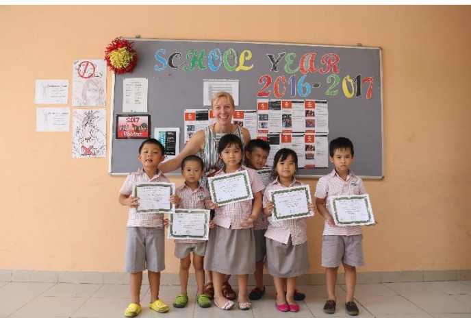
These Academic Achievers from Prep Have learned their 100 Basic Sight Words