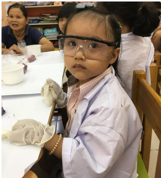
PRE-SCHOOL SOAP MAKING DAY Pre-school enjoyed pretended to be scientists! Mixing the ingredients to make a bar of soap.