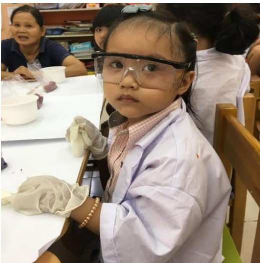
CÁC BÉ LỚP MẪU GIÁO LÀM XÀ PHÒNG Các bé lớp Mẫu giáo rất háo hức được tập làm nhà khoa học. Các bé đang trộn nguyên liệu để làm các thanh xà phòng