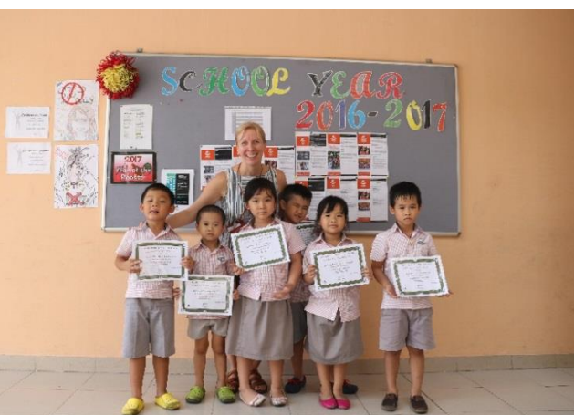
Các bạn lớp dự bị tiểu học nhận được giấy khen Các bạn đã học xong 100 từ cơ bản