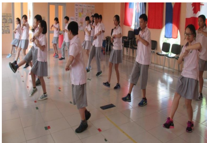
Students practice for concert

准时性在任何阶段的学习以及职业生涯很重要的因素。为培养学生这个方面的素质，我们希望学生都能在8:30准时到校学习。如果学生在8:45之后到校，他/她将收到由我们的前台给予的迟到通知到。家长收到后需要在这张单子上签字。