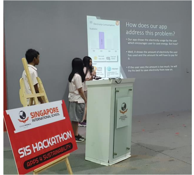
IGCSE 1 presentation