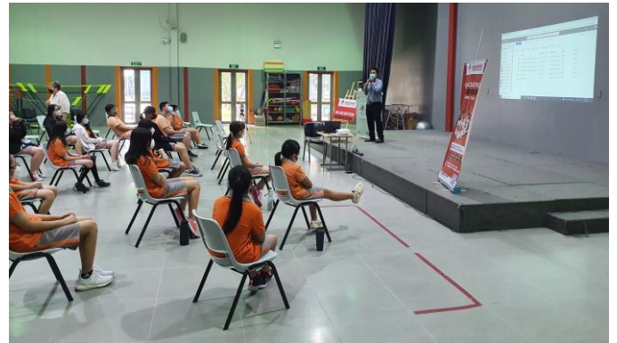
Our senior students watching the Hackathon presentations with interest