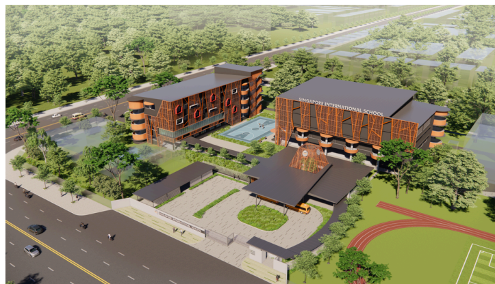
Phối cảnh các tòa nhà Giai đoạn 3 của trường Quốc tế Singapore (SIS) tại Thành phố Mới Bình Dương. Hình ảnh mang tính chất minh họa và có thể khác với tòa nhà thực tế.

Với các phòng học và phòng chức năng hiện đại cùng không gian rộng rãi cho các hoạt động nghệ thuật và thể thao, chúng tôi tin rằng các em sẽ có cơ hội phát triển toàn diện cả về trí tuệ và thể chất khi học tập tại trường Quốc tế Singapore.