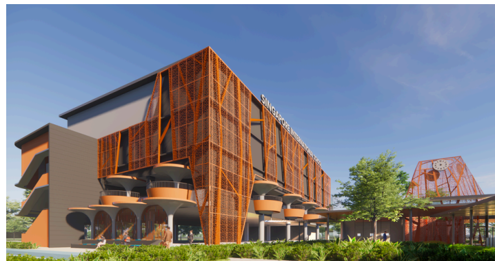
Phối cảnh các tòa nhà Giai đoạn 3 của trường Quốc tế Singapore (SIS) tại Thành phố Mới Bình Dương. Hình ảnh mang tính chất minh họa và có thể khác với tòa nhà thực tế.